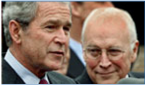
Bush pensó en librarse de Cheney en el 2004