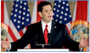
Marco Rubio se confirma como la gran esperanza republicana